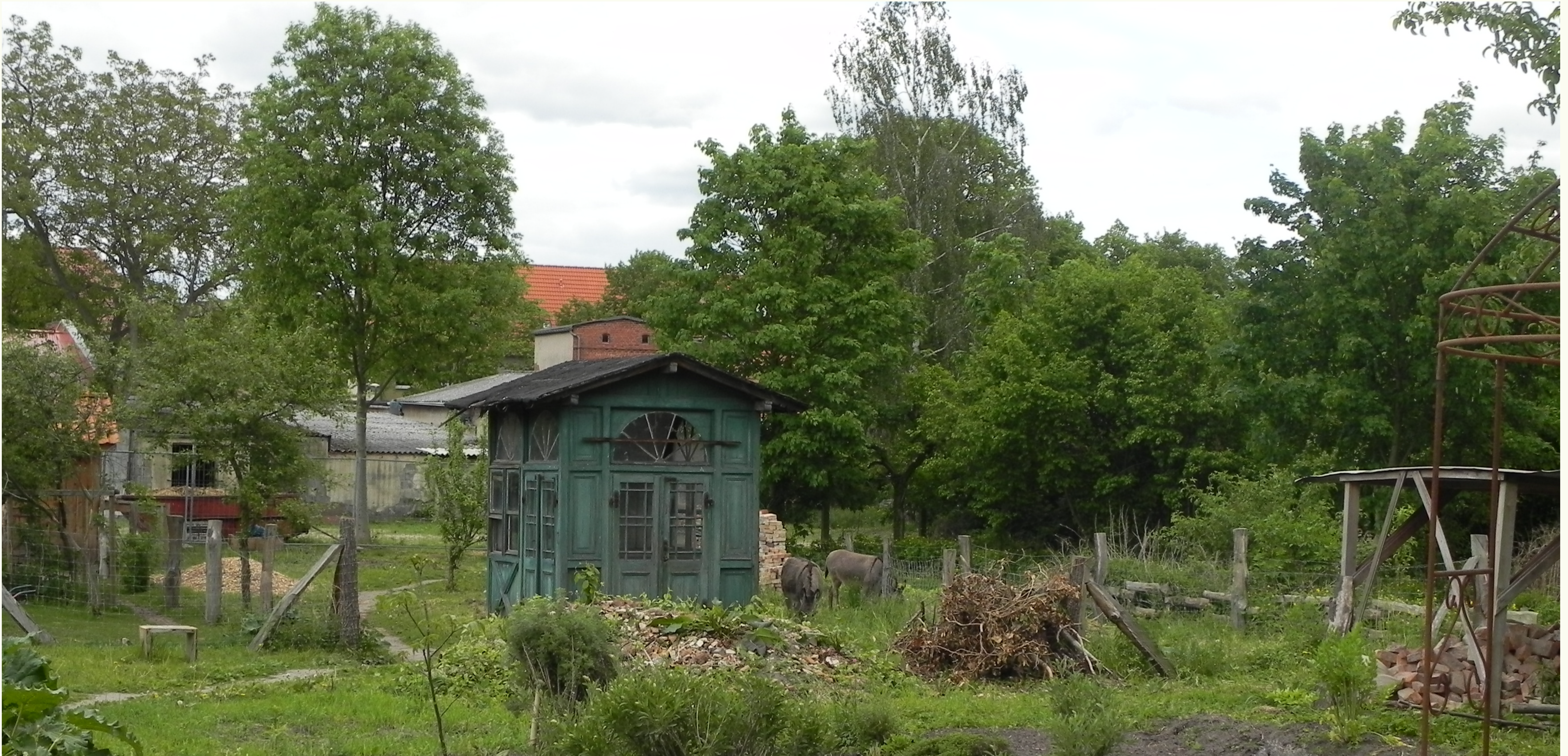
Garten & Pavillon 2012

denkMal und Leben e.V. Verein zur Sanierung und Nutzung denkmalgeschützter Gebäude