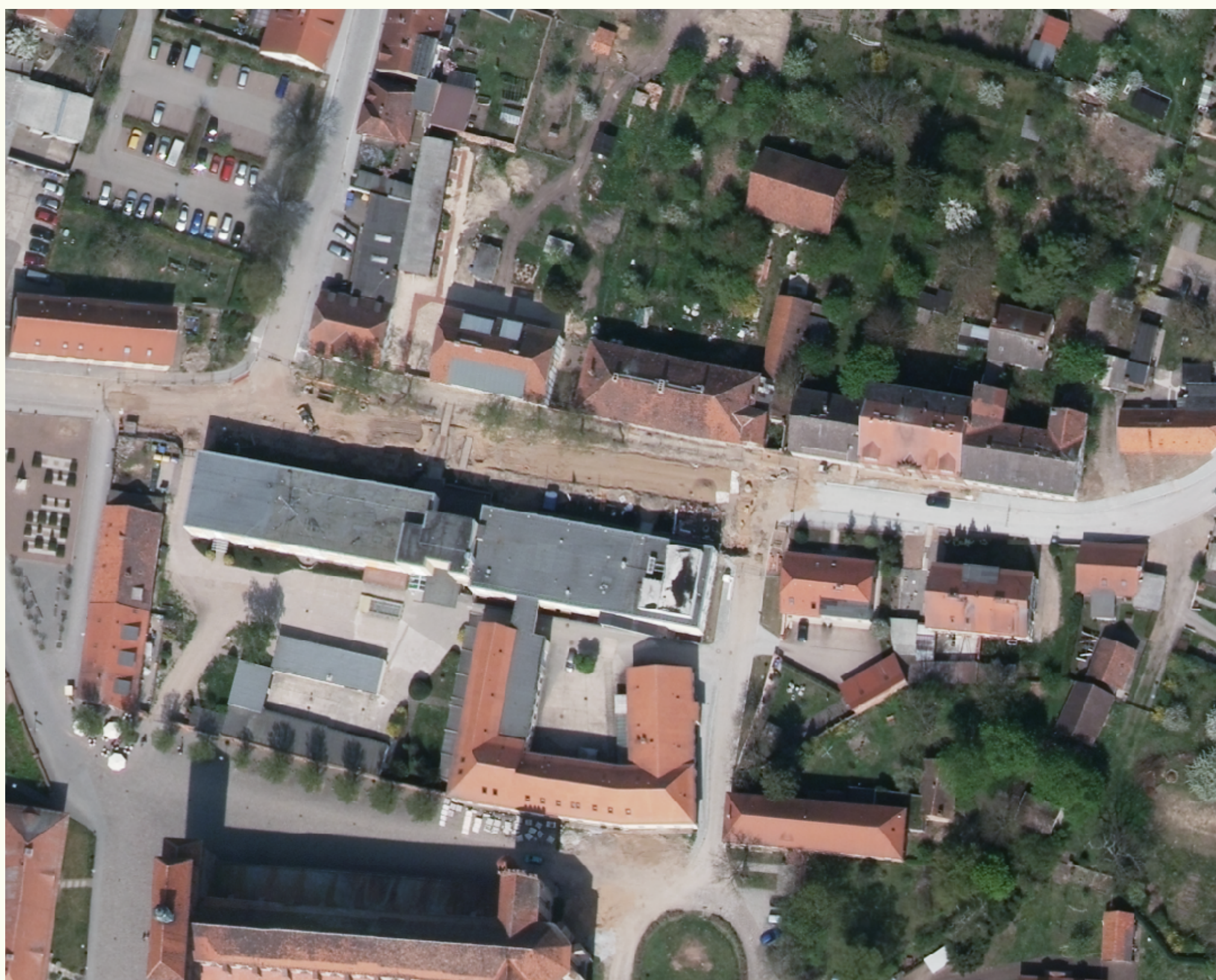
Domgebiet im Mai 2013

denkMal und Leben e.V. Verein zur Sanierung und Nutzung denkmalgeschützter Gebäude