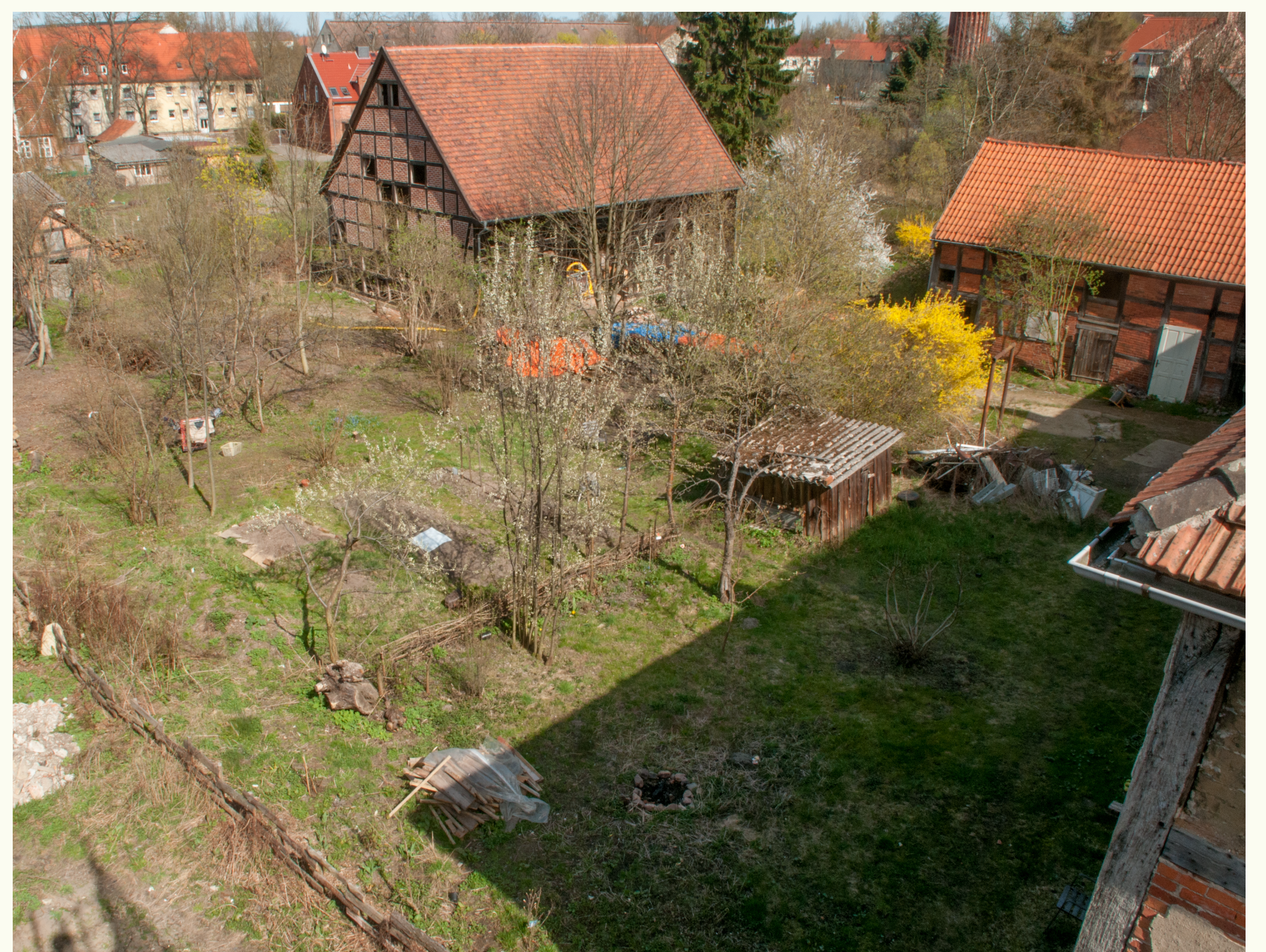
Garten der Domkurie D7 , Frühjahr 2011

Die Aktion: NaTür begleitet landesweit interessierte Menschen auf ihrem Weg zum ökologisch und naturnah gestalteten Garten. Die Aktion kommuniziert u.a. die drei Kernkriterien: Verzicht auf Torf, auf Pestizide, auf chemisch-synthetische „Kunstdünger“ und zeichnet Garteneigentümer, die nach den Kriterien ihre Anlage bewirtschaften, auf Antrag mit der Gartenplakette aus. ( gartenakademie-sachsen-anhalt.de ) Im breiten Spektrum von Gartenkunst, Gartenbau und –entwicklung, Pflege, Erhaltung und Gestaltung von Gärten fördert der gARTenakademie Sachsen-Anhalt e.V. mit der Aktion NaTür landesweit den Wissenstransfer zwischen Alt und Jung, Laien und Experten im regionalen und internationalen Kontext: Haus- und Kleingärten, historische Gärten und Parks, Anlagen an